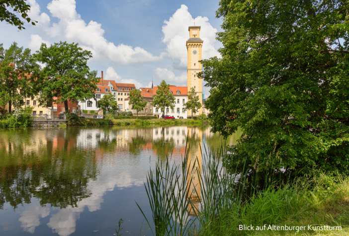
Blick auf Altenburger Kunstturm